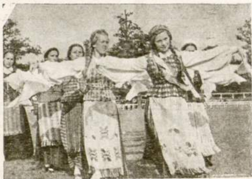
LIETUVAITES TAUT INUOS RUBUOSE soka tautinius sokius