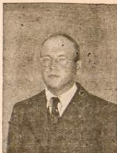
Rašytojas Kazys Čibiras - Verax.