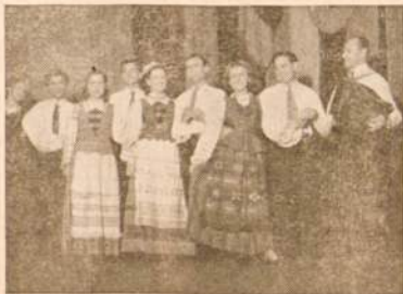
Prancūzijos lietuvių tautinių šokių šokėjų grupė. Lietuvių šokių originalumas ir jų meniškas atlikimas ne tik šią grupę ypatingai išpopuliarino prancūzų tarpe, bet jos lietuviškasis darbas daug padeda ir Lietuvos reikalui.