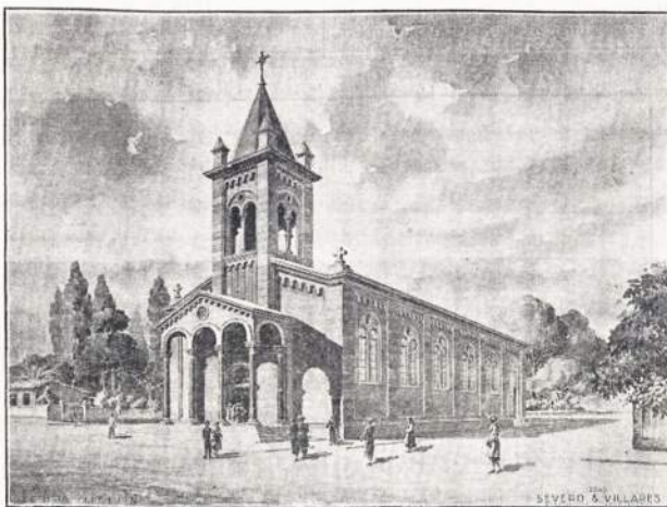
São Paulo lietuvių katalikų bažnyčia, numatyta statyti Vila Zelinoje.