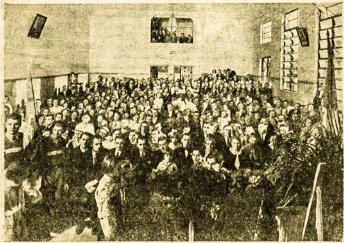
DARIAUS IR GIRĖNO TRAGINGOS MIRTIES 2-JU METU SUKAKTUVIU PAMINĖJIMO DALYVIAI, DARIAUS — GIRĖNO SALĖJE.

Praeitam savo gazietrs «Liet. Aidas Br.» leidinyje, to laikraščio ponai sapnuoja apie kokią tai slapta prieš nekurį laiką, mačiuliškos dvasios žmonių įsteigtą akcinę bendrovę «Braziliitas».