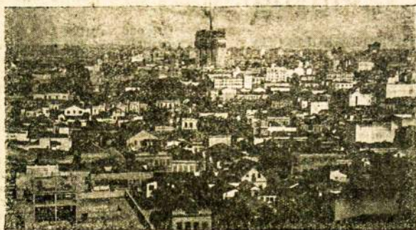
SÃO PAULO Miesto VAIZDAS.