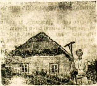
Vieykusių - Zaidnojos - Gaidnojos... veretas dar ir Zvejyba.