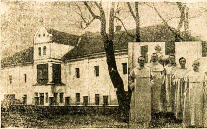
R senųjų domynikonų vienuolynas ir vienuoliai.