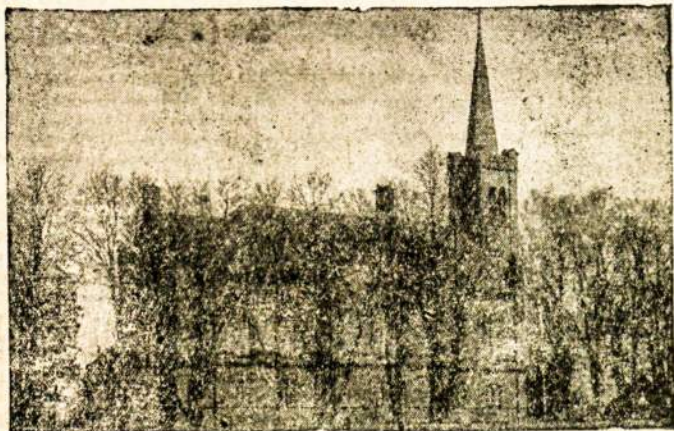
Biržų evangelikų reformatų bažnyčia.