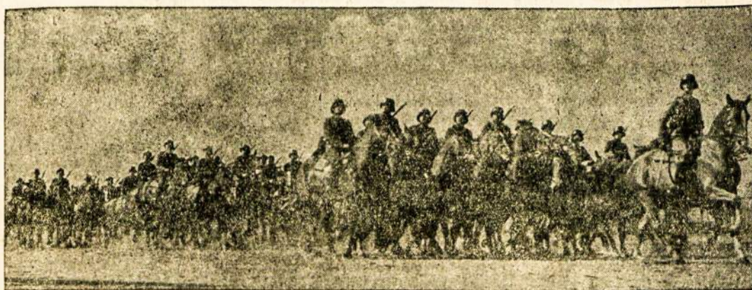
Lietuvos kavalerija parade

Negalime šiais metais pasigirti ir kultūrinio darbu. Bendrai mūsų kolonijoj nėra vienybės. Bet paskutiniu laiku įvyko dar didesnis susiskaldymas. Atsirado dar daugiau blogos valios žmonių, kurie labai daug žalos padarė mūsų kultūriniam gyvenime. Dėl kelių žmonių asmeniškių ambicijų skaudžiai nukentėjo visuomeniškas darbas ir viena kita organizacija. Tarpusavio lietuvių santykiai žemiai pablogėjo. Tai visa eilė liūdny faktų, rodančių mums, kad šie metai ištikrųjų nelaimingi ir mūsų kolonijai.