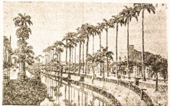
Kacalas Manque (Rio de Janeiro)

TIK «LIETUVY» PASISKELBĖS TAMSTA TURĖSI IŠ SKELBIMO NAU DA. SKELBIMU KAINOS PRIEINA MAUSIOS.