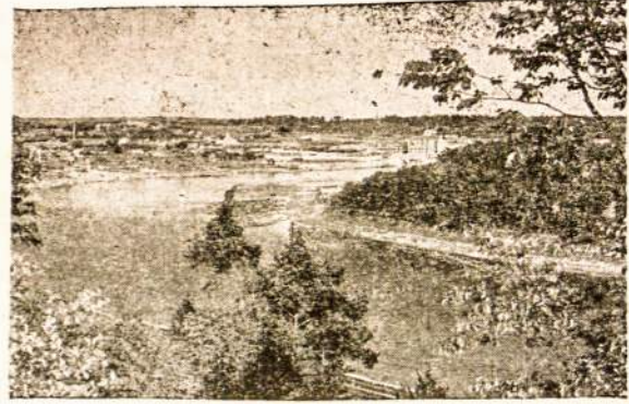
Petrašiūnai — Kaunas.

KIEKVIENO SKAITYTOJO PAREIGA laiku atnaujinti prenumeratą 1936 metams «Lietuvis» tikisi, kad ir Tamsta neatsiliksi nuo kitų. Pinigus siųsti įvertintu laišku: (valor declarado) «Lietuvis» caixa postal 1764, São Paulo.