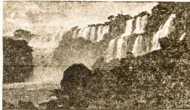
Iguasų kriokliai, Brazilijoje.

Deja, ir mokslinės teorijos kai kada neligai gyvena. Taip atsitiko ir su Darvino teorija, kad žmogus yra išsirituliojęs iš beždžionės. Evoliucija, arba nuoseklus plėtojimosi, tobulėjimo teorija, be abejoj, yra tam tikrais atžvilgiais teisinga, bet ji nevisur gali būti taikoma, kad iš vienos augalų, arba gyvių, rūšies galima išauginti kitos atmainos, kurios gali net skirtis išvaizda, spalva ir kai kuriomis savybėmis, yra seniai žinomas dalykas. Bet nėra įmanoma iš vienos kurios rūšies kitą, visiškai svetimą rūšį iš mežo nieku būdu negausim avizos ar rugio, nors ir kažin