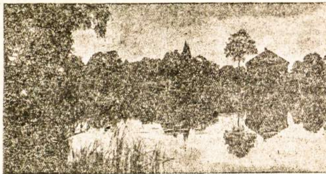
Vaidas iš Lietuvos apylinkių.

Vis tik, bendrai imant, Rio lietuvių didelė dauguma yra rimti žmonės, sveikali galvojančiai. Jie pasižymi darbštumu, jie nuolat rūpinasi savo ateitimi.