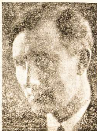
Lietuvos Operos Artistas-režisiorius PETRAS OLEKA