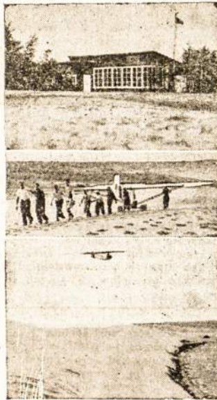
L. A. K. Sk'andyno mokykla Nydoje

kad jos tik tada gali būti laimingos, kada turi gražaus sudėjimo kūną. Bet faktai rodo, kad siešis grožis tuo atžvilgiu yra nepalyginamai vertingesnis. Prancūzė Remiar, nebe pirmos jannystės moteris, atradė tokią žavi, kad jai renkanti aukas būdavo aukojama tikstaučiais frankų. Kartą susirinko didžiulė minia pasveikinti iš Italijos grįžtančio Napoleono. Bet kada pamatė nuosaiiai stovinčią tą žavią moterį, visų akys nukrypo į ją, tartum ji būtų didysis iškilmų didvyris. Taip pat nebuvo graži ir garsioji ponita Stoeil. Bet ją puosė kažkos neapsakomas žavumas, kuris paprastą gražumą daug kuo pra-