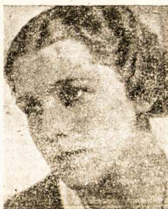
Lietuvos Operos Primadona VINČĖ JONUŠKAITĖ-ZAUNIENĖ