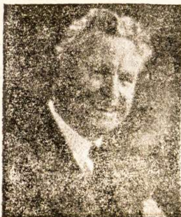
Lietuvos Operos Tėvas KIPRAS PETRAUSKAS

Lietuvių Sąjunga Brazilijoje ir "Lietuvio" Redakcija.