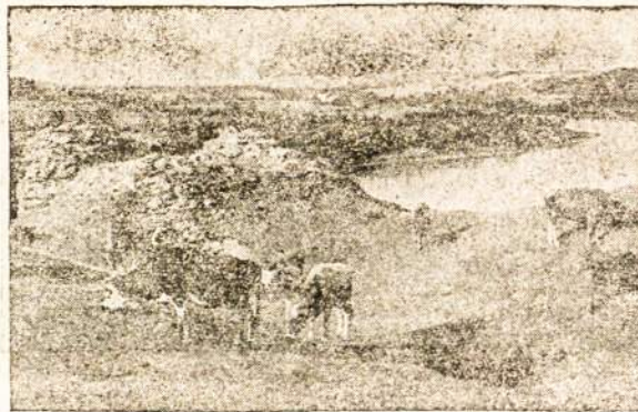
Lietuvos apylinkių vaizdas vasaros metu.

Amerikos laikraščiai ilgesnį laiką skiria daug vietos klausimui, kaip žmonės gyvens tolimoje ateityje. Rašinius iliustruoja gausūs paveikslai, kur matomi žmonės, visiškai skirtingi nuo