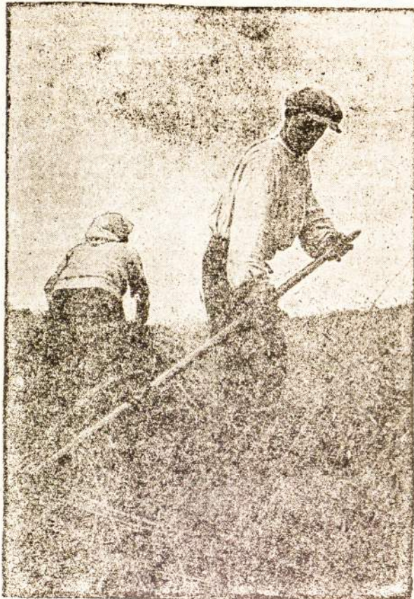
LIETUVOJE JAU RUGIAMIUTĖ.