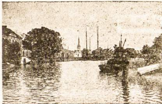
KLAIPĖDOS ŽVEJU UOSTAS.

— Bus veriau, jei jūs, ponė, dėl savo vaikų tylėsite.