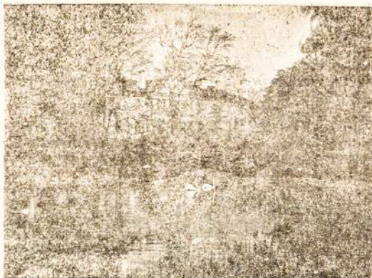
Kaune, butanikos sodas.

Lisabono seimas (cortes) labai iširdo del to, kad Rio de Janeiro paliko Dom Pedro. Tuo tarpu Brazilijos atstovai visai nieko nedarė del savo krašto. 1821 m. rugsėjo mėnesį buvo išleistas dekretas, kurio suglaustas turinys yra štoks: panaikinti Rio de Janeiro mieste vyriausias tribunolas ir visos kitos aukštos įstaigos, Dom Pedro turi