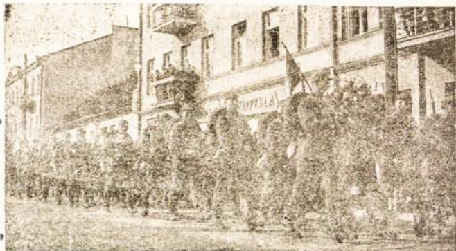
Lietuvos kariuomenė, apdovanota gėlėmis, iškilingai grįžta iš didžiųjų manevrų.

Jau buvo minėta, kad paskiruose kraštuose tarp vyriausybių, darbdavių ir darbininkų jau pasireiškia žymus santykių pagerėjimas. To paties siekia ir tarptautinė darbo organizacija,