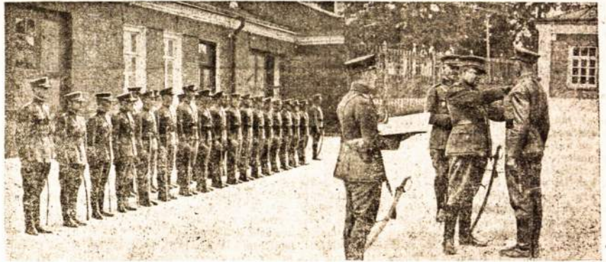
Nuspelnusių Lietuvos kareivių iškilmingas apdovanojimas: vadas prisega prie kareivio krūtinės garbės ženklą — medaļį.

Baigęs garbingo ir šiandien aukšto Lietuvos kariūninko — visos kariuomenės vado žodžius, turū pasabrėti tik tai, kad laiminga Lietuva, turėdama tokių savo sūnų. Jų turėjo, turė ir turės