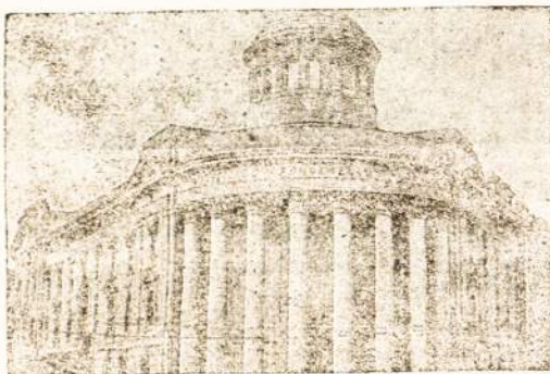
Lietuvos Teisingumo Ministerijos Rūmai.

Dabar kyla įdomus klausimas, kodėl lietuviai savo valstybės ženklu pasirinko šauknių raitelį Vytį, o ne erelį, liūtą ar kurį kitą galybės simbolį. Į tą įdomų klausimą šiandieną tiksliai atsakyti beveik negalima, bet pasiremiant charakteringomis senovės lietuvių būdo ypatybėmis, galima tiksliai spėjoti. Aš manau, kad mes nepadarėme teisingumo, spėdami, kad lietuviai savo Valstybės Ženklu pasirinko šauknių raitelį Vytį todėl, kad jie be galo mylėjo žirgus. Žirgas lietuviai buvo brangiausias ir artimiausias laimės ir nelaimės draugas: jis nešė lietuvį į kovos lauką, draug su juo kariavo, draug ir užrė. Senovėje, pasak Simono Daukanto, tas tebuvęs garsus jaunikaitis, kurs gražesni