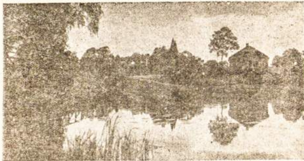
Mūsų Tėvynės vaizdelis.