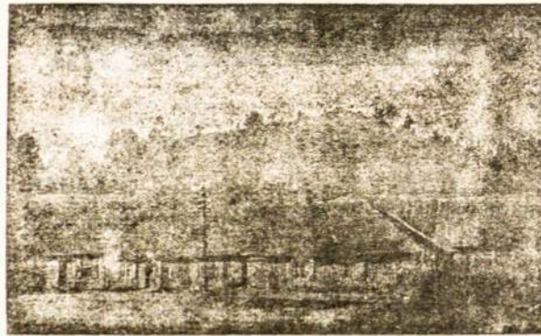
GEDIMINO KALNAS VILNIUJE (ties matomu kryžiu, 1341 m. buvo nušautas Vilniaus miesto įkūrėjas, D. L. K. Gedimanas.)