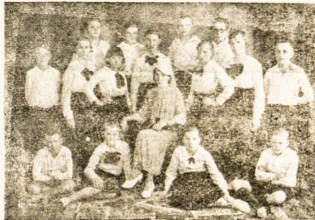
D. L. K. VYTAUTO MOKYKLOS 1936 M. LIETUVIŲ MOKINIŲ LAIDA.