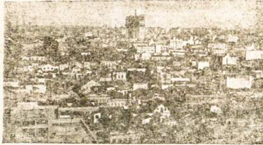
São Paulo miesto vaizdas.