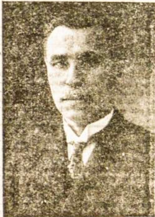
J. E. Ministeris Pirmininkas. Juozas Tūbelis.

Apsiginus nuo išorinių priešų skubiai imtasi kūribinio ir valstybės atstatymo darbo. Ir tas darbas buvo begaliniai sunkus, reikalaujantis visų Lietuvos sūnų nepaprasto pasiverimo.