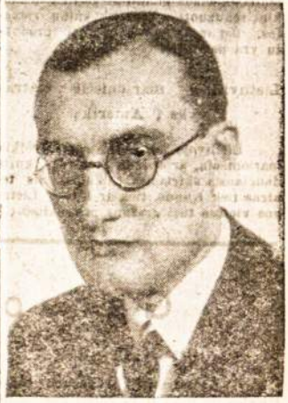
J. E. Užsienų Reikalų Ministeris Stasys Lozoraitis.

Pažymėtina, kad Kinija yra nuolatinių neramumų ir revoliucijų žalis.