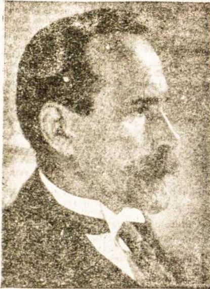
J. E. pirmasis ir dabartinis Lietuvos Respublikos Prezidentas Antanas Smetona.

Lietuvai atsidurus dideliu pavojuje čia vėl pasirodė Lietuvos kariuomenės nepaprastas savo krašto likimu