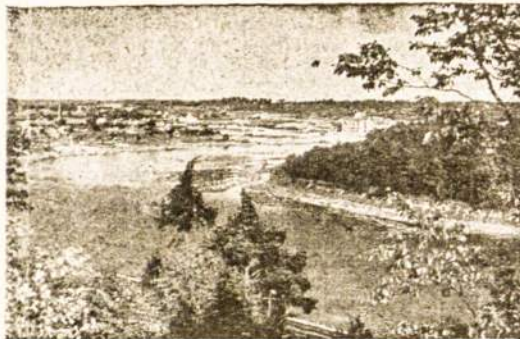
Mūsų Tėvynės Lietuvos vaizdas.

Be taupomųjų valstybės kasų ir jų skyrių, Lietuvoje dar yra ir visa