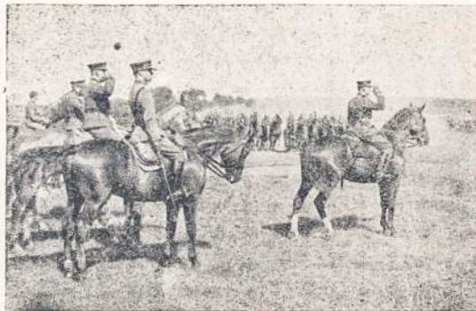
Lietuvos kavalerijos paradas.