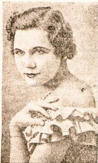
Amerikos lietuvaitė dainininkė.