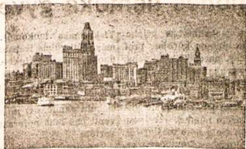
Taip atrodo vienas iš Amerikos didmiesčių.