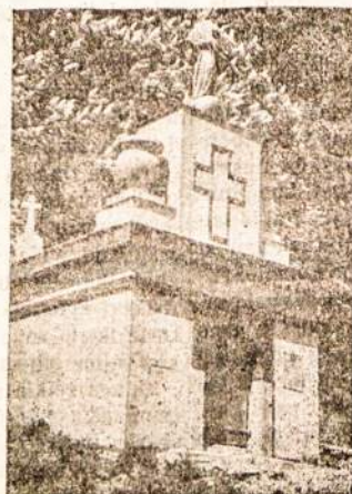
Dariaus ir Girėno mauzoliejus.