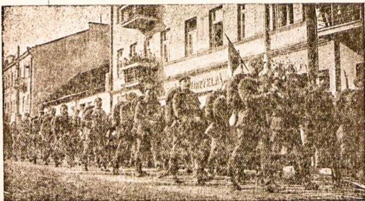
Lietuvos kareiviai dainuodami žygiuoja Kauno gatvėmis.