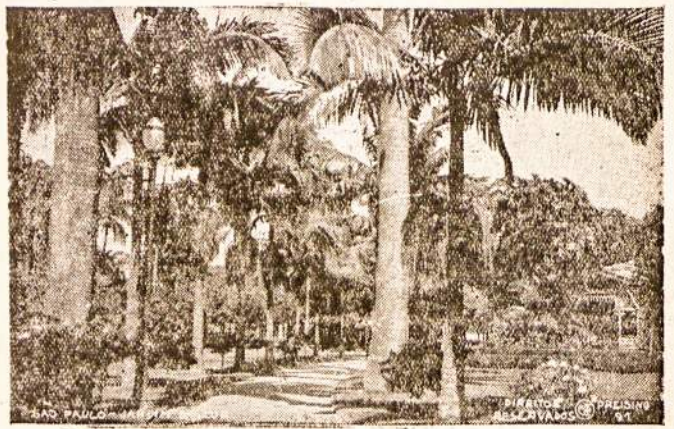
São Paulo Luz parkas, kur kiekvieną sekmadienį susirenka daug lietuvių pasivaikščioti ir grynu oru pakviepuoti.