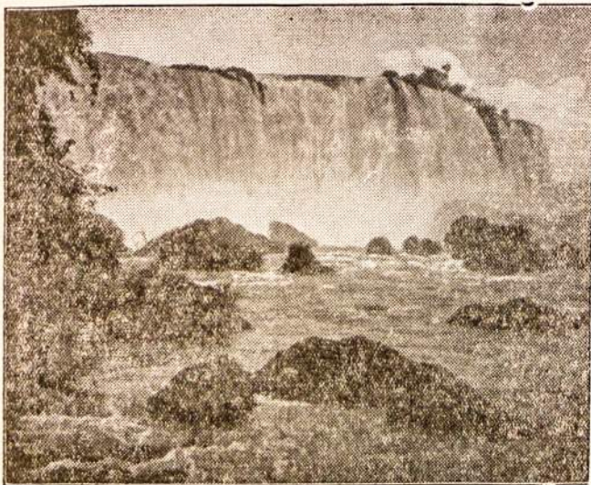
Vieni iš didžiausių pasauly Iguasų kriokliai. Čia matome [viena iš tų krioklių, vadinama „Marechal Floriano“]Peixoto“. Kriokliai randasi ant Argentinos, Brazilijos ir Paragvajaus sienos, Pietų Amerikos žemyne.