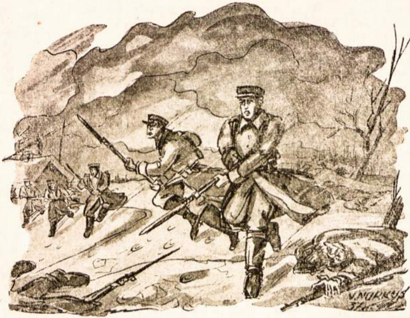
Lietuvos savanoriai 1919 metais puola bolševikus durtuvais.