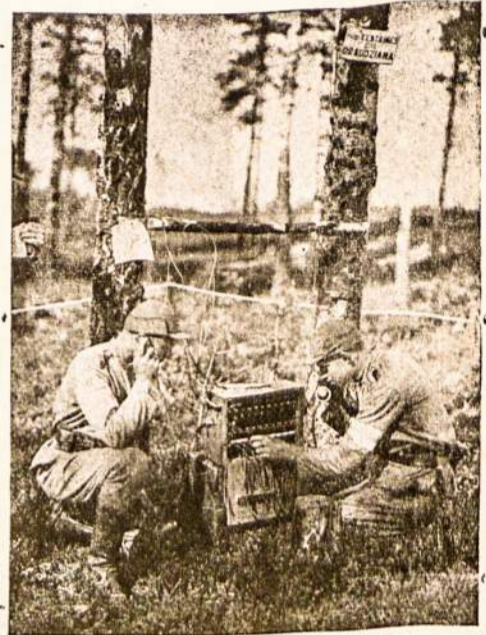
Lietuvos kareiviai manevruose: lauko telefono stotis.