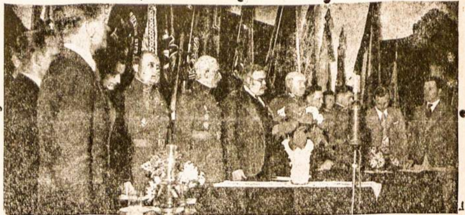
Iškilmės Vytauto Didžiojo Universitete.