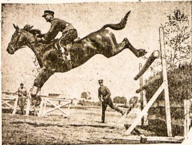
Lietuvos raitininkas šoka per kliūtis.