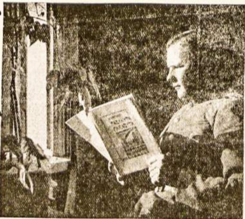
Lietuvos kariuonis skaito Respublikos Prezidento raštų rinkinį „Pasakyta — Parašyta“.

timintis ir svajonėmis vėl pergyventi anuos garbingus laikus, jie suteikė mūsų dvasiai stiprumo ir tikėjimo. Taigi, Vytauto vainikavimo sukaktis yra mūsų stiprybės ir laisvės simbolis. Šiandien neturime vytautiškos Lietuvos nuo Baltijos iki Juodųjų jūrų. Tačiau vedami vytautiškos vieningos dvasios, kurią įkvepia mums savo idėjomis tautos aukščiausią pagarbą savo dideliais darbais šių dienų mūsų Tautos Vadas Antanas Smetona esame stipri, kūrbinga tauta, kurios jėga šiandien yra vidurinis susiklausymas ir taikos troškimai. Šių dienų Lietuva savo istorinės reikšmės nėra nustoju si. Ji yra viena Europos taikos grandies stipriausių žiedų. Ji dvidešimtmečio kūryboje yra įrodžiusi savo teisę nepriklauso mai tvarkytis ir pajėgumą kurybinės jos nepriklausomybės laikotarpio laimėjimais galėtų didžiūotis bet kuri kita tauta, ken-