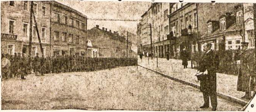
Iš Lietuvos karių iškilmių.