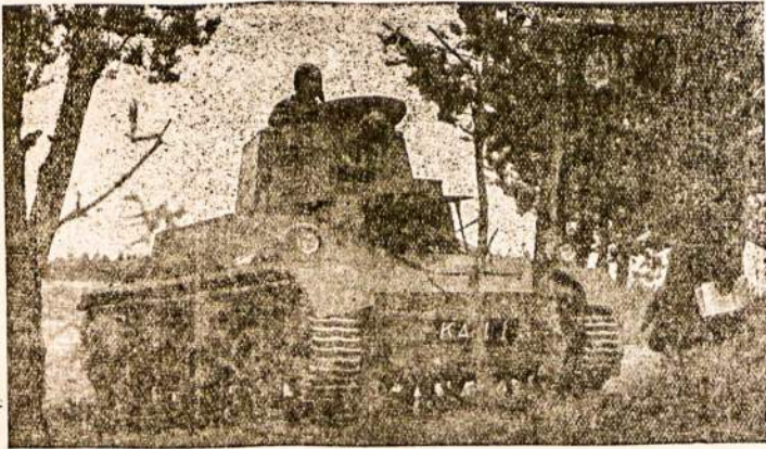
Lietuvos kariuomenės tankas.