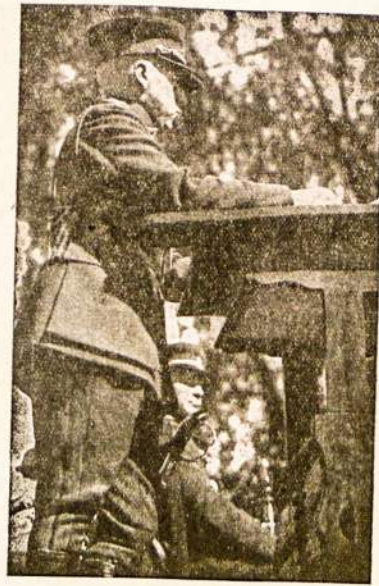
Kariuomenės Vadas brigados generolas Raštikis iškilmių metu kalba.