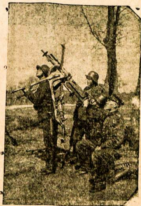
Lietuvos kareiviai bando ar sunkus savasis kulkosvaidis.