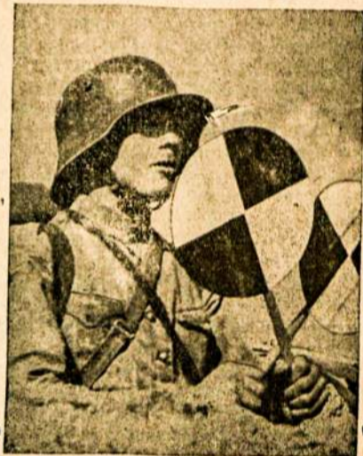
Lietuvos kareivis signalizuoja (kalbasi ženklais) skydeliais.