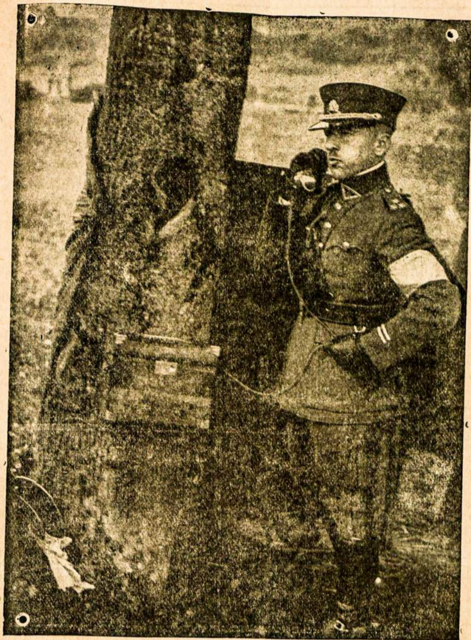
Lietuvos kariuomenės vadas brigados generolas Raštikis manevrų lauke kalbasi telefonu.