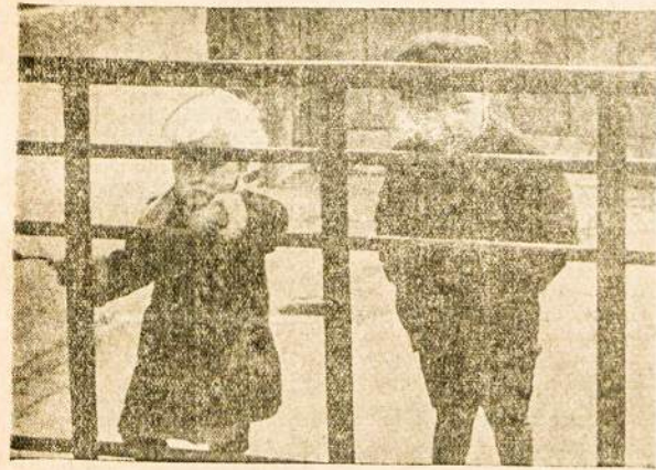
Pro tvorą į aikštę žiūri, kur vyresnieji žiema naudojami.

vėlių ar prekybos įmonių savininkai. Keletą milijonų pezu mūsų tautiečiai yra pasidėję su taupų bankuose. Gal daugiau negu iš kitų Pietų Amerikos kolonijų yra pasisuntę giminėms į Lietuvą. Bet ir visa tai sudėjęs vistiek negaliu pasakyti, kad Buenos Aires miesto lietuviai daug yra uždirbę, kad yra daug laimėję šioj svetimoj šaly. Jei apskaičiuosim, kad kiekvienas vykdamas į Argentiną turėjo iš Lietuvos pasiimti po du tūkstantčius litų, tai ir optimistiškiausiai skaitant nerasime, kad B. Aires lietuvių kolonija turi pini gais ar kitu koku turtu tokį kapitalą, kokį yra išsivežusi iš Lietuvos. O tas parodo, kad Buenos Aires, o dar labiau kitų vietų P. Amerikos lietuviai per 10—15 metų nėra susitaupę nė tiek, kiek yra išsivežę iš Lietuvos. Šią faktą turėtų įsidėmėti kiekvienas Lietuvos lietuvis, norįs vykti į P. Ameriką materialinės laimės ieškoti. Tiek Buenos Aires mieste, tiek visoj Argentinoj ar Urugvajų maža dalelė bus ir tokių, kurie dabar daugiau turi turto negu turėjo Lietuvoj, bet didžioji dauguma ne tik turto nesuikrovė, bet ir juodai dienai menkai tesusitaupė arba ir visai be jokios atsargos atėičiai gyvena tik šia diena, o kas darbo neturi, tas baisiai skursta.