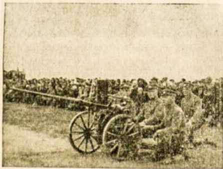
Lietuvos kariai supažindina visuomenę su nauju karo pabūklu — Oerlikonu.

Anglijoje neseniai buvo toks nepaprastas atsitikimas. Vieną mė Valijos miestelyje buvo apsisistojęs keliaująs cirkas. Netikėtai iš narvo ištrūko liūtas. Tačiau, laimei, žvėris niekur nebėgo, o atsigulė prie narvo.