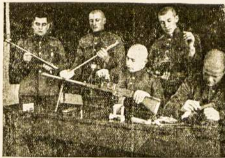
Lietuvos kareiviai valo savo ginklus.

Tame pačiame posėdyje dar kalbėjo vienas ukrainų atstovas dėl kurio kalbos irgi kilo triukšmas, kadangi jis puolė tenkų spaudos informaciją apie Karpatų Ukrainą ir įrodinėjo, kad Lenkijoje gyvenantieji ukrainai, ir gyvenantieji Karpatų Ukrai-