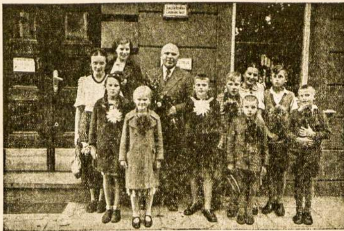
Vokietijos lietuvaitės ir lietuviukai 1937 m. vasarą apsilankę Lietuvoje.

už laivų perpaukimą. Italija už tai sumoka kasmet šimtus milijonų lirų. Tas pat yra su uostu Džibuti, kuris yra prancūzų. Per jį Italija įvažiuoja į Abisiniją. Vadinasi, šiuo atveju irgi priklauso nuo prancūzų malonės. Dar blogiau, kad vienintelis geležkelis Abisinijoje, kuri dabar yra Italijos imperija, irgi prancūzų nuosavybė. Taigi italai užkariatoje Abisinijoje važinėja prancūzų geležkelio, mokėdami, žinoma, už tai didžiulę prancūzams nuomą. Tai ir visi Musolinio nuoširdūs reikalavimai. Tačiau viešai reikalauja-