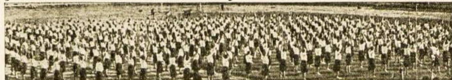
Jaunosios Lietuvos mergaitės daro atskirus pratimus Klaipėdos sąskrydyje.

kumo ir kultūros reikalams. Laikraščio kilnius tikslus visados aukštai vertino visi susipratę Brazilijos lietuviai ir tik todėl jam pavyko apsiginti nuo visokiųjų puolimų, provokacijų ir pasikėsinimų.