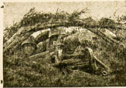
Lietuvos kulkosvaidininkai pozicijoje.

Pagaliau, didžiųjų demokrati jų nuolaidumas taip pat kada nors turės ribas. Viena yra aišku, kad Anglija, Prancūzija ir J. Amerikos Valstybės dabar dar aparčiau ginkluojasi. Vadinasi, ruošiasi lemiamam karui, kuris turės būtina kilti. O ki lus karui Vokietija turės pralai mėti, nes savo pusėje greičiausia bus tik ji viena. Italija ne labai patikimas Vokietijos sąjun gininkas. Italija visuomet šlieja