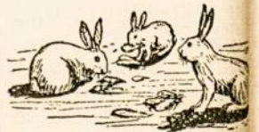
Žiemos šalčiai siaučia O zuikeliai želmenis graužia

Tai pasakęs, išėjo namo pa (Pabaiga iš 8 pusl.)