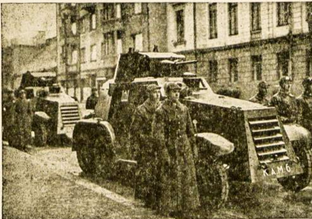
Sarvočiai — malonūs vaizduose ga.ingi kovose.