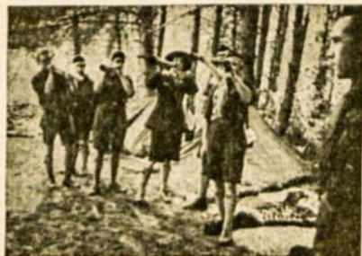
Skautų rytmetinė maldą stovykloje.

Prieš keletą metų Indijoje dar buvo tokių vienuolių užlaikoma ligoninė, kur gydėsi ir viešėjo 5.000 pelių.