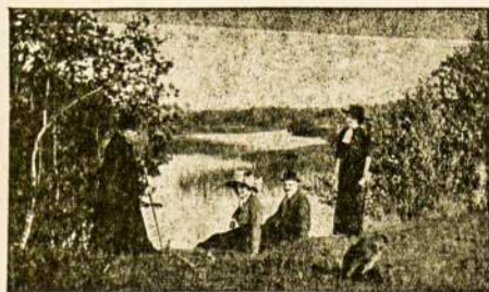
Atgimstančios Lietuvos švietėjai anais laikais panemuny

nušauta ir prie kiekvieno paukščio kojos buvo rasta maži siuntiniai, kuriuose buvo po 2-3 tūkstantinius banknotus. Tuo būdu kontrabandininkai su pašto karvelių pagalba gabeno pinigus iš Italijos. Austrijoje vienas dvarininkas nuolat pradėjo rengti didelius pasilinksminimus savo dvare, esančiame prie sienos. Pramogų metu jis leisdavo raketas, kurios vis krisdavo į kaimyninės valstybės laukus. Pradėjus sekti, buvo nustatyta, kad dvarininkas raketomis siuntė pinigus į kitą valstybę. Sudėjęs į rutuliuoką keletą tūkstantinių, pridišdavo jas prie raketos