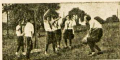
Krepšinio žaidimo sportas išjudino ir mergaites.

Ir taip tas ženklas, pakeitęs savo reikšmę ir net pavidalą /kartais kryžiaus galai esti užlaužti į dešinę, kartais į kairę/ yra randamas visose iškasenose. Jis randamas graikų induose ir Pompejos griuvėsiuose, taip pat Škotijoje ir Palestinoje pas Hittitus ir Tibete, Šiaurės Amerikoje ir ten kur kitados buvo pastatyta Kartaga. Jis randamas taipgi ir krikščionių katalumbosė, kur jis tą patį reikšė, kaip kad išganymo inkaras. Didesniam mokslininkų nustebimui, svastika pasirodė 1925 m. pas Panamos čiaubūvius: indėnai