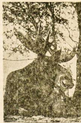
Galingųjų Lietuvos miškų gyventojas žavusis briedis.

Tada kiškis iš džiaugsmo ėmė juoktis. juoktis, net jam lūpelės perplyšo.