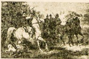
Mūsų tėvynės, senovėje, gyvenimo vaizdas.

Senesniosios kartos žmonės dar atsmena, koks buvo sveikatos reikalų rūpinimas prieškariniais laikais. Tikrai didesniuose miestuose buvo kelios ankštos ir menkai įrengtos ligoninės, prieinamos turtingesniems miestiečiams. Miestuose buvo ir gydytojų. Bet lietuviškąjį sodžių aptarnaudavo vien mažamoksliai felčeriai, kurie gydydavo visas ligas ir net dantis traukdavo. Šalia felčerių, žmones „gydė“ dar burtininkai, užkalbinėtojai ir kitoki apgaidinėtojai.