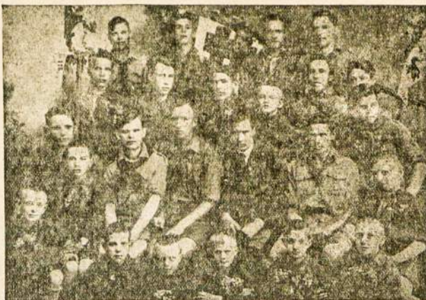
Lietuvos jaunimas skautų eilėse.