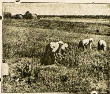
Gimtines laukuose, prisiminimo vaizdelis.

Universiteto klinikos bus aukšto lygio gydymo ir mokslo įstaiga, kuri turės didelės reikšmės viso krašto sveikatingumui reikalų tvarkymui bei tobulinimui. Tą reikšmę ir naudą numano visi gyventojai, todėl visur reikiama pasitenkinimas tokio vyriausybės užsimojimu, ir nesigailima stambių išlaidų, kurios grįš tautai sveikatos pavaldiu, vertingesniu bet už kokių pinigų.