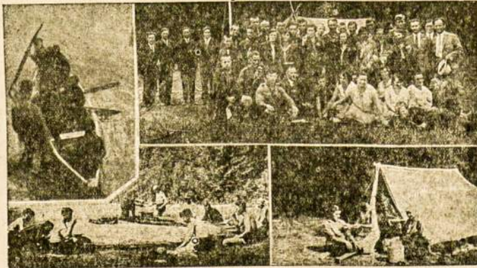
Vaideliai iš Lietuvos skautų stovyklos.