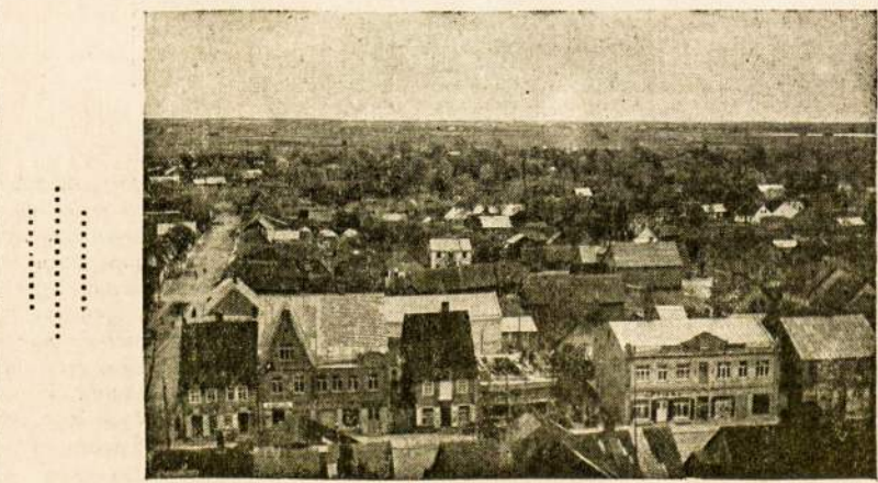
Biržų miesto vaizdas.

— Tas visai ir nesvarbu, man bu, kad tamsta laikai savo kose skūstuvą, — paaiškina klientas.