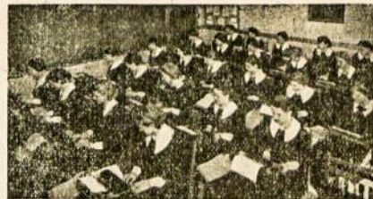
Lietuviai mokiniai užsiėmimo metu.