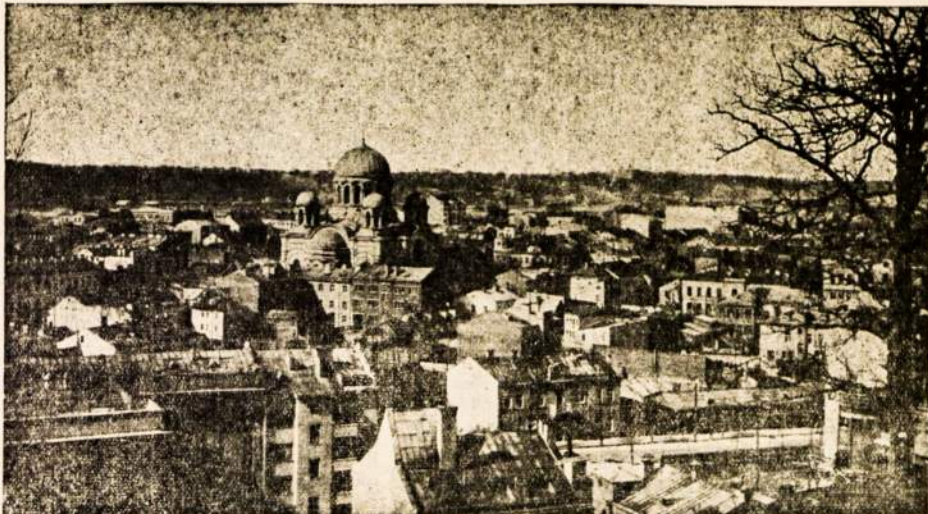
Laikineji Lietuvos sostinė Kaunas.