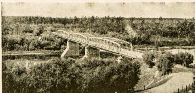
Būdingas mūsų tėvynės vaizdas.

go tą pačią žemę. Nors badas atrodo didelė nelaimė (nuo jo kasmet miršta milijonai žmonių, kadangi ten visuomet yra skur-