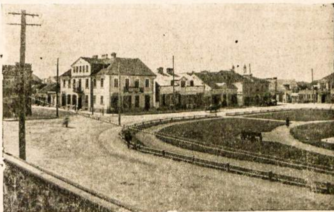
Žavus Biržų miesto vaizdas.

gas konkurentas — Italijos imperija. Italija savo norą irgi įsitvirtinti Viduržemio jūroje motyvuoja ypatinga savo geopolitine padėtimi. Ji, kaip pušiasialio valstybė, apie 80% savo importo (maisto produktų ir žaliavos) gabenasi jūros keliais. Italai nurodo, kad Anglija Vi-