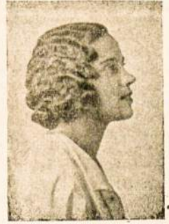
Jauna Amerikos lietuvaitė studentė.