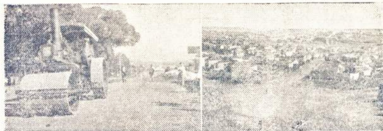
Av. Zelina grindimo darbai.