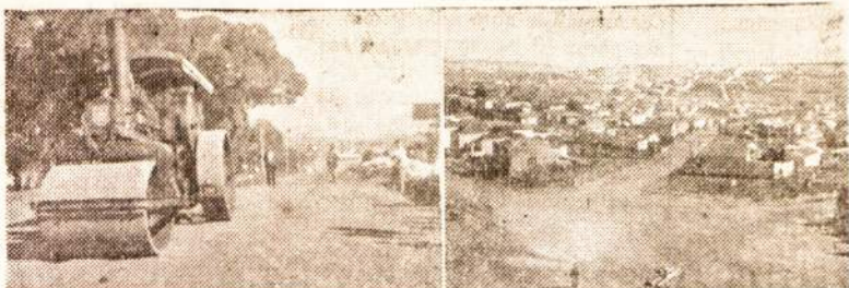
Av. Zelina grindimo darbai.