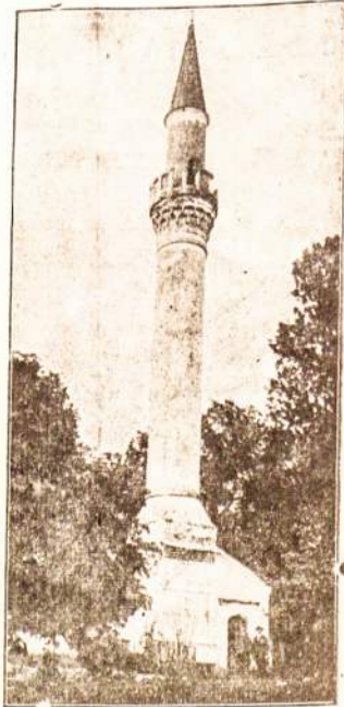
Lietuvos musulmonų bažnyčia (mečetė) Kedainiuose.

Virsuje suminėtu skaitmenų akivaizdoje kiekvienam aišku, kad Ašies valstybės negali bent šiandien manyti apie kokį nors karišką žygi. Toks žygis joms būtų pražūtingas.