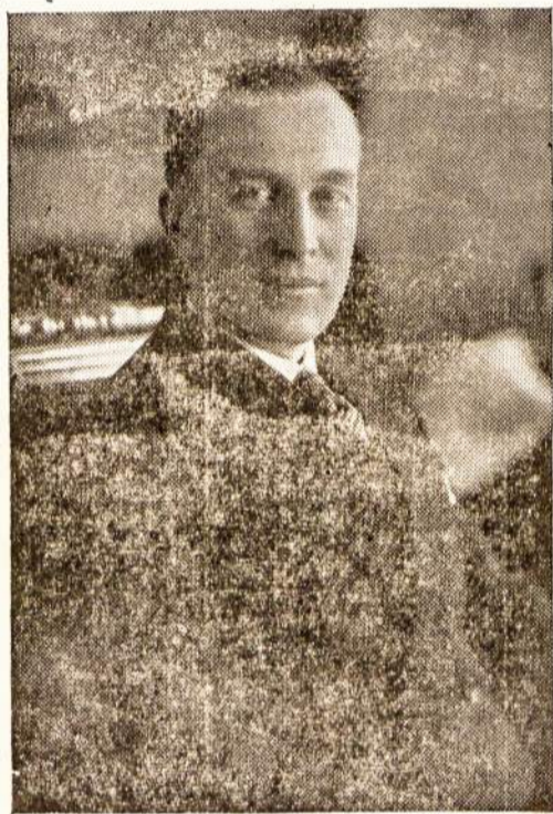
Lietuvos Užsienių Reikalų Ministras. JUOZAS URBŠYS.

Nesigalėkime darbo, pas- tangų ir pasišventimo kil- niam lietuviškos spaudos dar- bui. Dirbkime visi kaip kas mokame, kad mūsų laikraš- tis augtų ir tobulėtų kartu su mūsų išeičių gyvenimu.