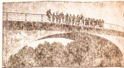
Naujas moderniškasis tiltas Lietuvoje.