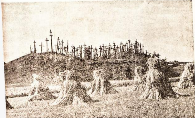
metinė duona. Už gubų matosi Kryžių kalnas ties Meškučiais Šiaulių apskrityje. O rusų susaudyti ir palaidoti 1863 metų keli lietuviai sukilėliai, jų atminimui apy- atė slaptai kryžius. Vėliau šį kalną pradėjo lankyti iš visos Lietuvos maldininkai odami paguodos. Dabar Kryžių kalnas turi kelis tūkstančius kryžių, kryželių.

is dienomis Pramonės kybos Departamentas