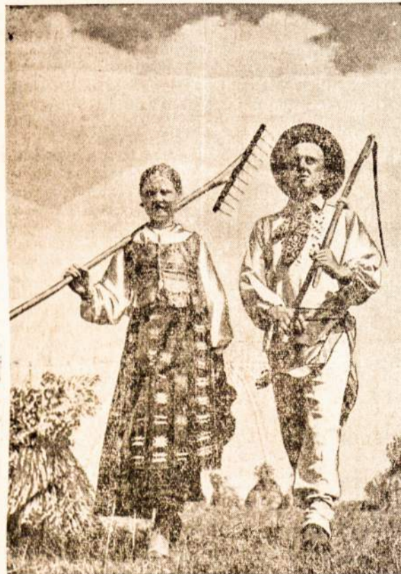
Ant pečių dalgelis plieno, Čiaupos merguzėlė. Bernuželių nebevienas:

Baltijos valstybėms tokias pat garantijas, kokios yra duotos Lenkijai, Rumunijai, Graikijai. Už šio „mažmožio“ derybos ir užkliuvo. Žinoma tam tikra prasme tai yra iš tiesų mažmožis, liečias daugiau formą, negu esmę. Norint, čia lengvai galima rasti kompromisą: 1) galima su teikti Baltijos valstybėms garantijas, visai jų neatsiklausus, arba 2) galima susitarti padėti Baltijos valstybėms, jei jos pačios pagalbos paprašys. Ir vieno ir antro būdo praktiškos pasekmės būtų tos pačios. Tačiau šis tariamas mažmožis turi dar gilesnę prasmę, kuri iš karto nėra matoma. O toji prasmė