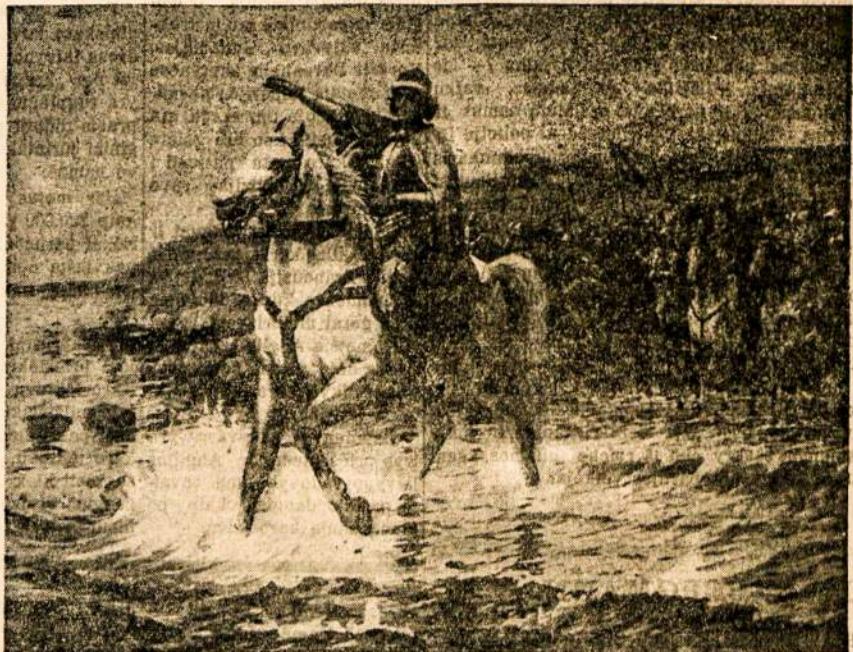
XV amžiuje Vytautas Didysis Juodosiose jūrose prijungia Krimo pusiasalį prie Lietuvos imperijos. No seculo XV Grão-Duque Vytautas no mar Negro incorpora a peninsula Crimea ao Imperio da Lithuania.

— Liepos 21 d. keli šimtai uniškų su nuosirdžiais broškais linkėjimais palydėjo ilniaus lietuvių studentų ekskursiją, kuri, paviesėjusi Lietuvoje 2 savaites, grįžo į Vilų. Studentams įteikta daug yvanų: lietuviškų knygų, tauš. rankdarbių.