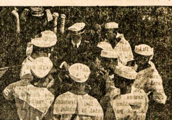
„Prezidento A. Smetonos“ laivo igula.

— Vokiečiai Prancūzijoje, Vokietijos pasieniuose slaptai platina visokius pamfletus ir atsišaukimus, nukreiptus prieš Prancūziją. Prancūzų policija kiršintojus stropiai persekioja.