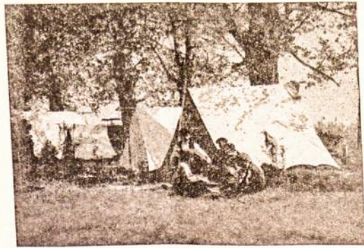
Lietuvos skautų palapinių miestas.

Kadangi užsieninis popierius yra daug geresnis ir daug pigesnis už vietinį, tai „Lietuvio“ gavęs leidimą spausdinti ir kalendorių ant užsieninio popieriaus tuo sutapsys kelis šimtus milreisų. Tokiu būdu kalendorių galima bus išleisti tikrai didelį ir gražų.