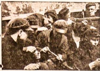
Šiais neramiais laikais šalia knygos būtina ir šautuvas pažinti.