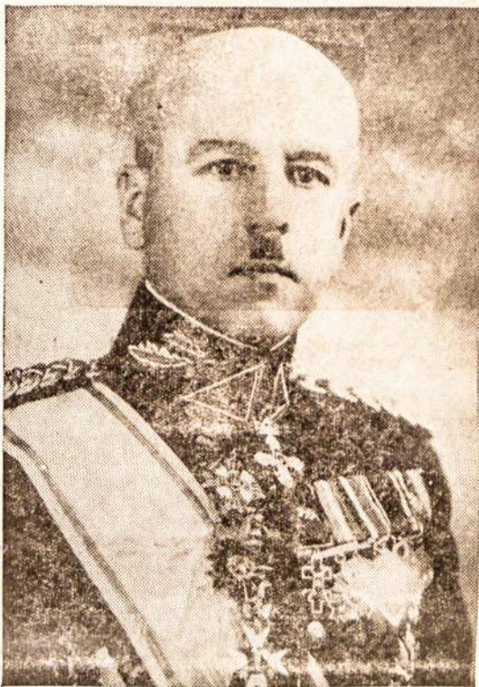
Lietuvos Kariuomenės Vadas BRIGADOS GENEROLAS STASYS RAŠTIKIS.

Laikraščiai praneša, kad Hitleris dėjo pastangas tam, kad į Vokietiją tartis su juo esiginiai atvyktų koks nors Lenkijos žymus valstybės vyks, būtent: prezidentas, maršas Smygły ar Bekas. Hitleris manė, kad atvykusis erlyną lenkų valstybės atsivui privers pastarąjį pasitviti Lenkijos nusileidimą j.