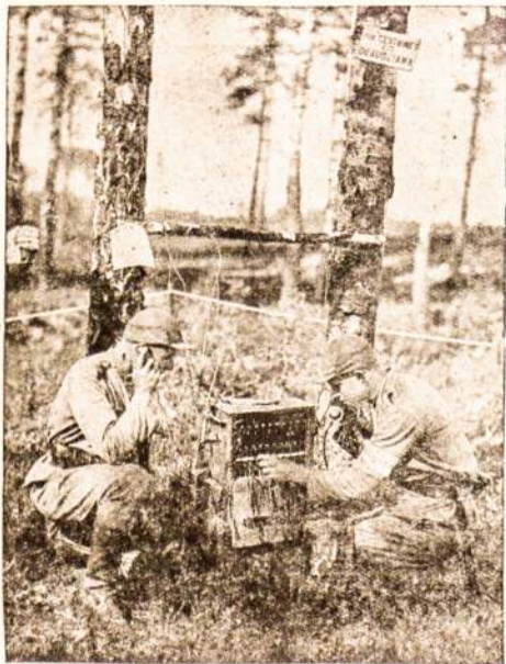
Mūsų sekimas parubežy šiuo neramiu laiku.

era o fio da luz de salvação. Entretanto, todos se aproximaram muito do precipicio; a vertigem do abismo destruiu o tenue de luz; e nada mais foi bastante para deter o irremediavel. A guerra — esse hecatombe que se recebeu durante annos e annos, e, mais particularmente, de setembro de 1938 para cá — esta em acto. Uma nova cartada do destino da Europa está lançada.