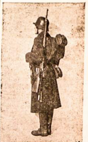
Tai Lietuvos kareivis.

Latvijos spauda paskelbė žymių lenkijos politikų oficialius pranešimus, kuriuos tvirtinama, kad Lenkija karą tikrai laimės ir ant sutriuškintų Vokietijos griuvėsių sukurs didelę Lenkijos valstybę. Prie dabartinės Lenkijos bus dar prijungta Rytprūsiai, koridorius su Dancigu ir visa Silėzija.