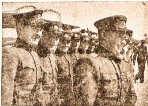
Laukia tik kovos trimto.

Dancigui p. Burekoard. P. Burekoardt pranešė spaudos atstovams, kad jau jo misija Dancige esanti baigta. Rugs-