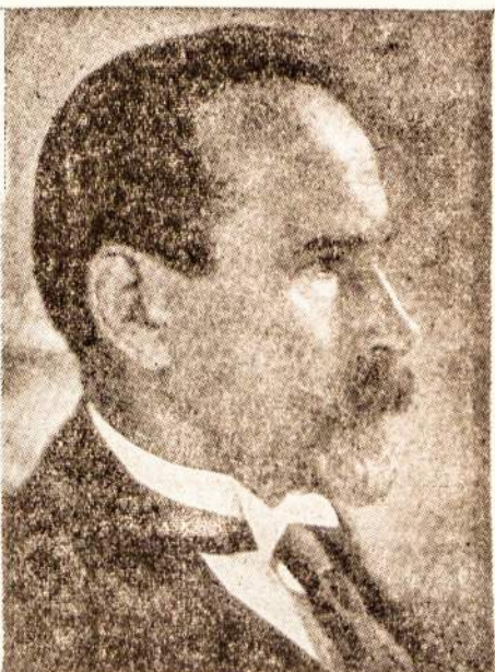
Lietuvos Respublikos Prezidentas Antanas Smetona, kuris sekmėnigai ir išmintingai vadovauja Lietuvos valstybei šiuo sunkiu ir pavojingu momentu.

bar Slovakija. Šiaurėje BUSIANTI PALIKTA NEPRIKLAUSOMA LIETUVA IR JAI PRISKIRTAS VILNIAUS MIESTAS BEI KRAŠTAS, KURĮ NUO 1920 METŲ TURĖJO UŽĖMĘ LENKAI. Latvija ir Estija užimsianti Sovietų Rusija, kad turėti laisvą išėjimą į Baltijos jūrą. Sovietai ir vokiečiai palieka vidury Lenkiją ir Lietuvą tam, kad neturėtų bendrų sienų. Jei ištikrųjų šis Lenkijos padalinimas įvyks, tai Latvijos ir Estijos nepriklausomybei grėsia didžiausias pavojus.