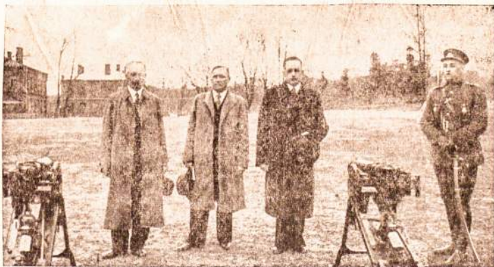
Lietuvos visuomenės paaugoti ginklai įteikiami kariuomenei.