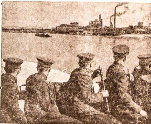
Lietuvos kariai ekskursijoje. Toliau matyti Klaipėdos m.ostas.

Naujausios žinios praneša, kad Sovietai jau baigia užimti visą Vilniaus kraštą net iki Rytprūsijų. Taip pat pranešama, kad Sovietų Rusija ir Vokietija pakartotinai garantavusios Lietuvos neutralitetą. Jei vokiečiai ir sovietai Lietuvos atžvilgiu laikys savo žodį, tai Lietuvai pavojaus nebus.