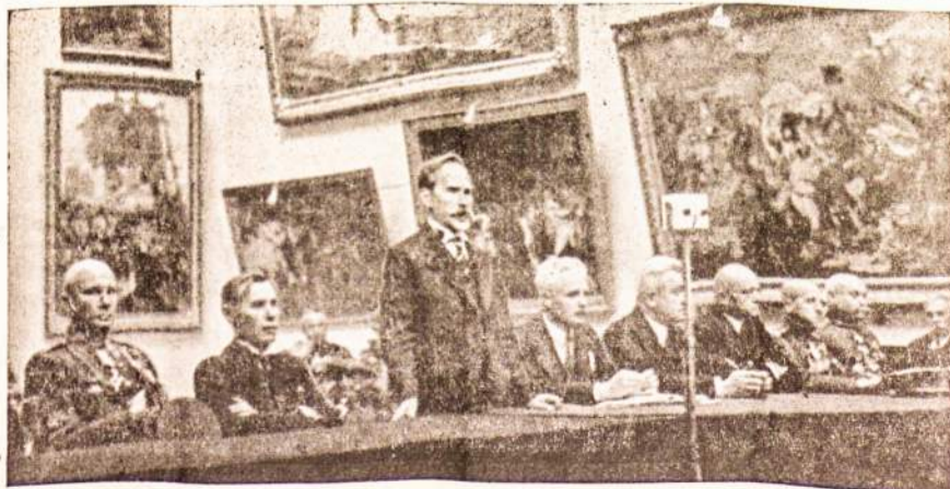
Respublikos Prezidentas kalba iškilmingam posėdy.