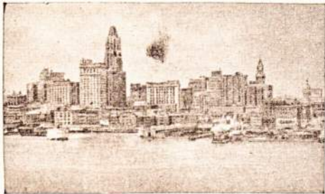
Amerikos didmiesčio Čikagos vaizdas.