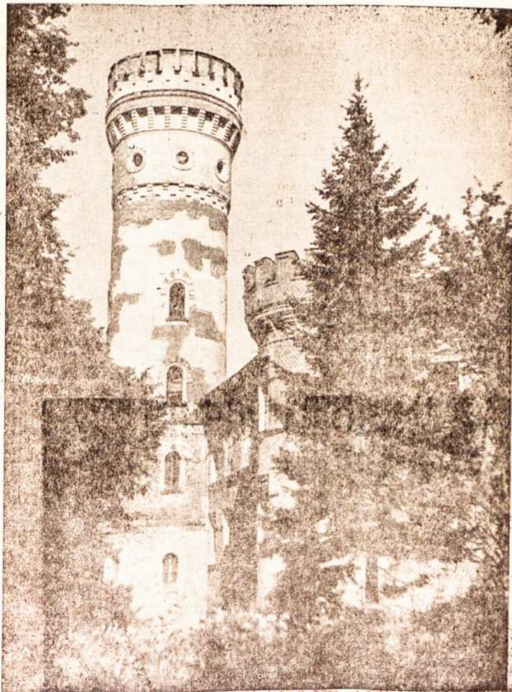
Raudonės pilis ant Nemuno krantų.

TIK „LIETUVIŲ“ SKAITYDAMAS VISKĄ ŽINOSI.