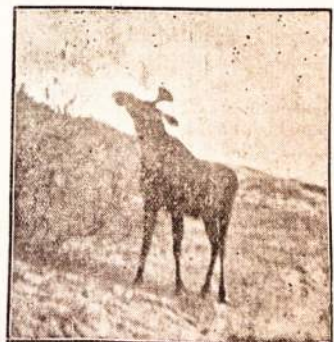
Lietuvos gyventojas briedis.

— Os japonezes iniciaram am Pelping (Pekim) a demonstração das celebres muralhas da China.