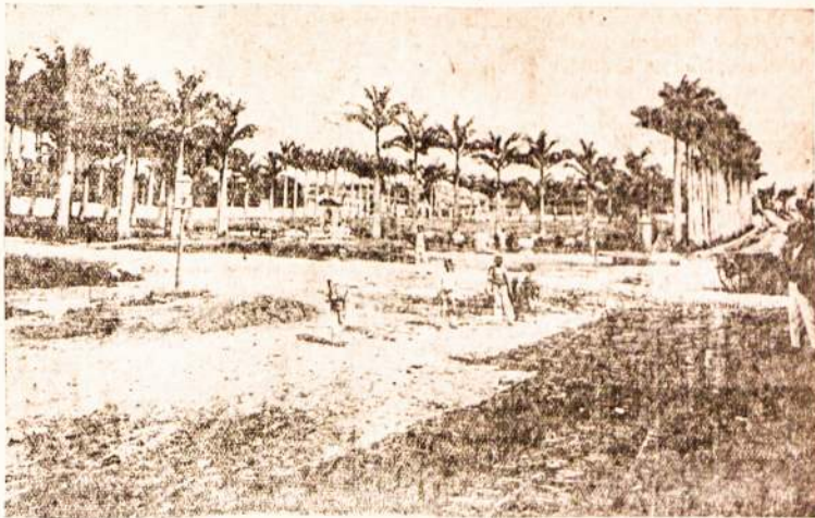
SENASIS „CARLOS GOMES“ PARKAS CAMPINAS MIESTE

Numatoma Lietuvoje išparceliuoti ir likviduoti sava-