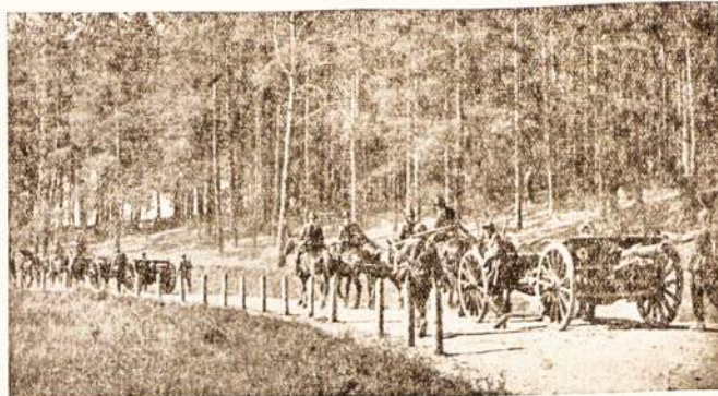
Lietuvos lengvoji artilerija.

Amerikos valdžioje ilgą laiką gresia patvirtino neutralumo įstatymo pakeitimą. Amerikos prezidentas Ruzveltas lapkričio 3 d. jau pasirašė dekretą, kurio leidžiama laisvai pardavinėti ginklus ir amuniciją. Kadangi Amerikoje labai daug ginklų užsakė Anglija ir Prancūzija, tai jos šiuo įstatymu pakeitimu ir galės pasinaudoti. Laikraščiai rašo, kad Amerikos neutralumo įstatymo pakeitimas yra pirmas žingsnis įsikišimui į karą.