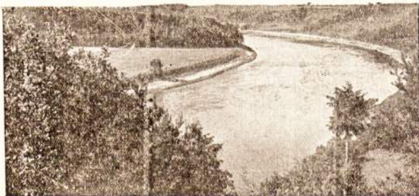
Ten kur Nemunas banguoja...

Apesar do tempo ter melhorado, não foi deseneandada a grande offensiva na frente occidental. As patrulhas germanicas procuram sondar a resistencia das tropas francezas e obter dados sob re a posições adversarias