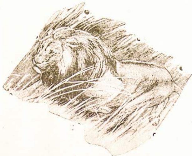
Afrikos džianglių gyventojas liūtas.

Skaityk „Lietuvį“ ir žinosi viską kas dedasi pa-sauly.