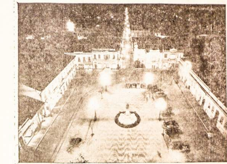
Campinas miestas naktį.

Naujausios žinios praneša, kad Sovietų Rusija grąžino Lietuvai tik dalį Vilniaus krašto teritorijos. Be Vilniaus kiti didesnieji miestai, kaip Gardinas, Lyda, Ašmena ir net Švenčionys liko Sovietų