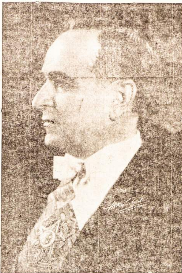
Brazilijos Respublikos Prezidentas Getulio Vargas, ukaris askpelnė 1937 m. nauja Brazilijos Konstitucija.

Olandijos slaptoji policija susekė slaptą vokiečių planą, pagal kurį jie ruošiasi su dideliu smarkumu užpulti Olandiją ir Belgiją. Per šių dviejų valstybių teritoriją vokiečiai nori pulti sąjungininkus. Mat Belgijos ir Olandijos sienų prancūzų fortifikacijos linija yra daug silpnesnė, todėl vokiečiai tikisi per jas prasilausti. Susekus slaptą vokiečių planą olandai ir belgais smarkumu stiprina savo sienas nuo vokiečių pusės ir ruošiasi sutikti puolimą. Vokiečiai pasiekti šiuo metu sukoncentravo daug kariuomenę prie Belgijos ir Olandijos sienų.