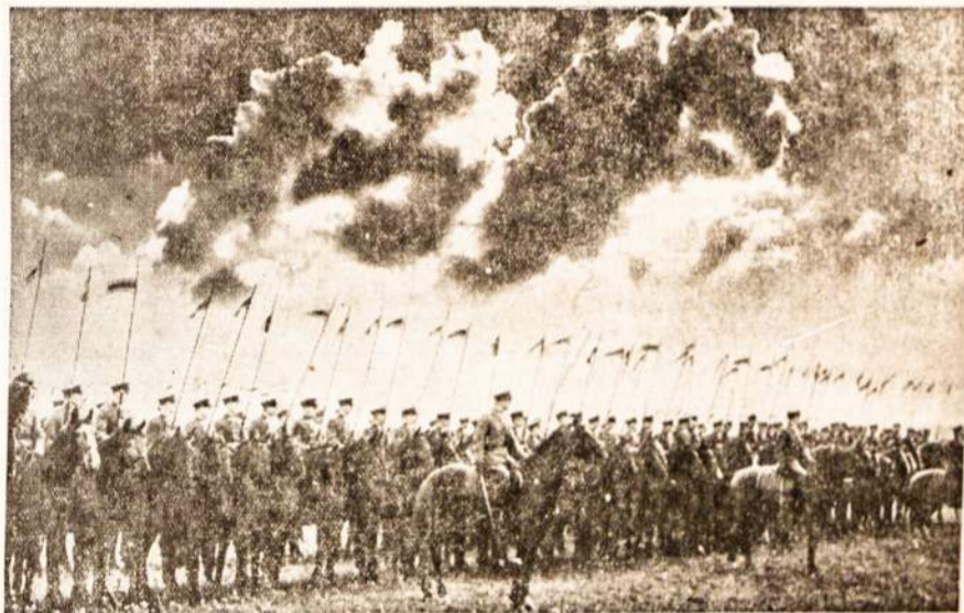
Lietuvos Kariuomenės Kavalerija.

Kiek liečia neutraliosios valstybės visuomenės santykius su internuotaisiais jį turi vengti rodyti jiems savo simpatiją ar neapykantą išskyrus mielaširdingumą ir gėilles tingumą. Todėl Lietuvos vi suomenė turi vengti rodyti savo jausmus internuotiesiems kad nebūtų progos kariaujančioms šalims daryti nepalankių mūsų tautai ir valstybei išvadų. Šiuo atžvilgiu yra labai įsidėmėtinas Estijos pavvyzdys, kada iš Talino uosto pabėgo internuotas lenkų povandeninis laivas.