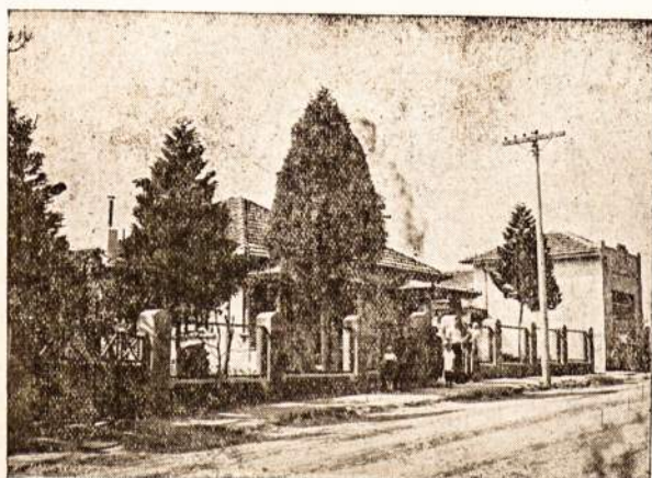
Lietuvio namai Vila Zelinoje.

Dėl smarkiai padidėjusio darbo „LIETUVIO“ redakcija kartu su Agencia Ralickas