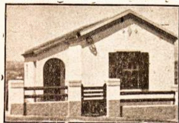
Naujas namas už 4:985$000

Trečiadienį Rio de Janeiro garsioji Brazilijos plaukikė Maria Lenk pastatė naują rekordą nuplaukdama per 2,55 min. Iki šiol, šis rekordas priklausė olandei Walberg su 2,56,9 min. O Sieglin da Lenk pasižymėjo 200 nugara, paimdama Pietų Amerikos rekordą su 2,58,2 m. 1.