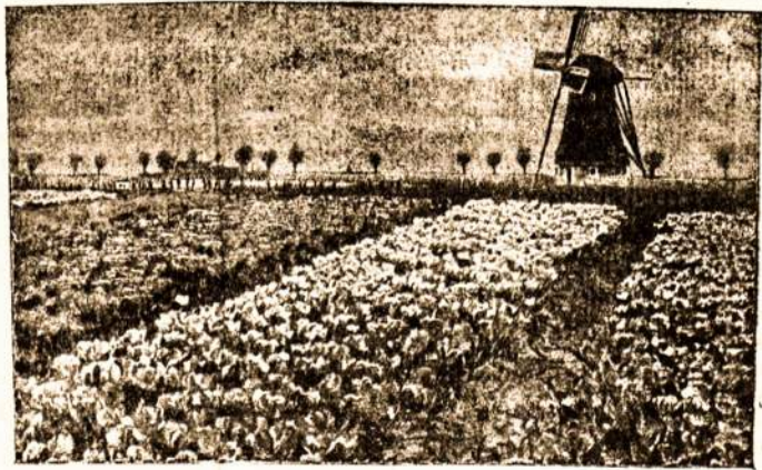
Gėlių laukas Olandijoje.