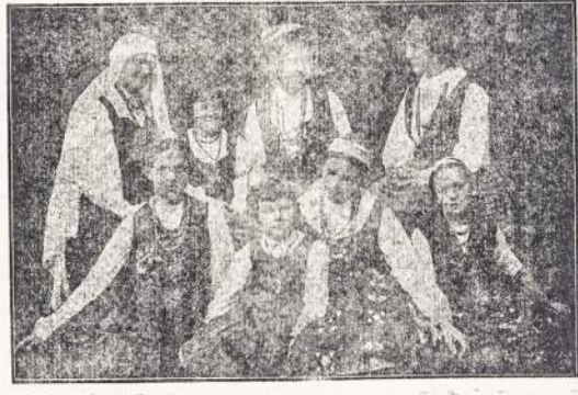
Lietuvaišės pasipuošusiu tautiškais rūbais.

Skaityk „Lietuvį“ ir žinosi viską kas dedasi pašauli.