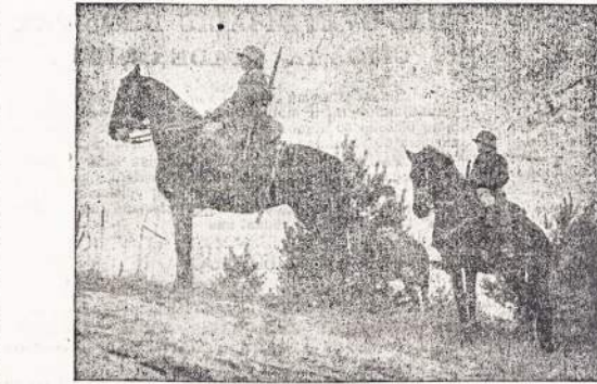
Lietuvos kariai žvalgyboje.

Vokiečiai deda visas pastangas, kad sutrukdytų sąjungininkų prekybą su užsieniais. Vokiečiai prekinius laivus skandina be jokių pranešimų, todėl dažnai pasitaiko, kad nusikandintų laivų įgula nepėja išsigelbėti ir nuskaeta kartu su laivu.