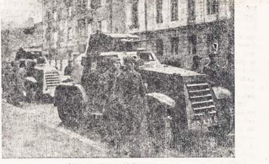
Lietuvos sarvočiai manevruose.

Mūsų bendradarbis apklau sinėje visus mokytojus, apie